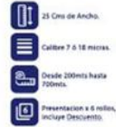
Vinipel Transparente de 25 Cms x 6 Rollos