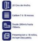
Vinipel Transparente de 20 Cms x 18 Rollos