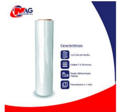
Vinipel Transparente de 12,5 Cms x 1 rollo