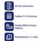
Vinipel Transparente de 30 Cms x 1 rollo