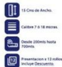
Vinipel Transparente de 15 Cms x 12 Rollos