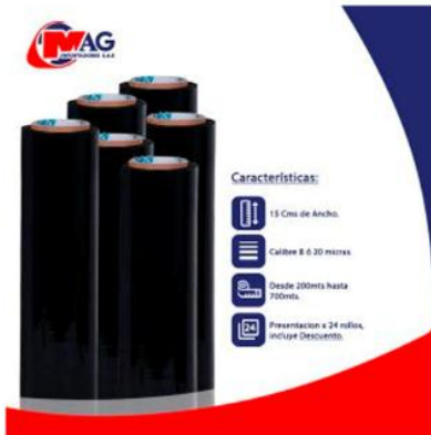
Vinipel Negro de 15 Cms x 24 Rollos