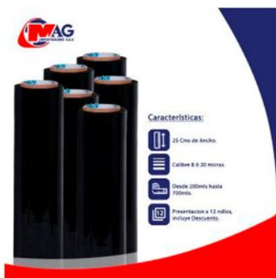
Vinipel Negro de 25 Cms x 12 Rollos