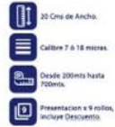
Vinipel Transparente de 20 Cms x 9 Rollos