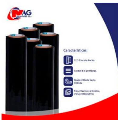
Vinipel Negro de 12,5 Cms x 24 Rollos