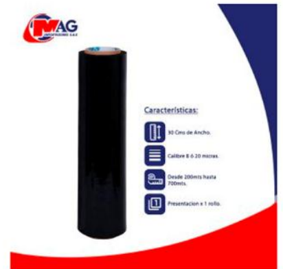
Vinipel Negro de 30 Cms x 1 rollo