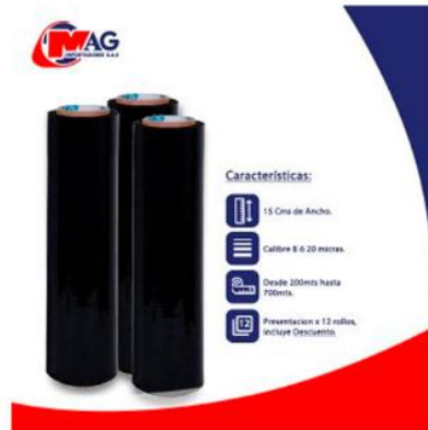
Vinipel Negro de 15 Cms x 12 Rollos