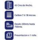
Vinipel Transparente de 45 Cms x 1 rollo