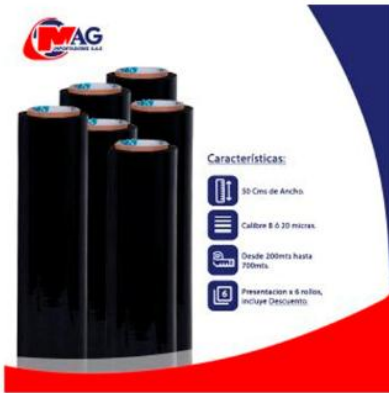
Vinipel Negro de 50 Cms x 6 Rollos