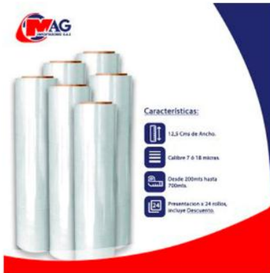
Vinipel Transparente de 12,5 Cms x 24 Rollos