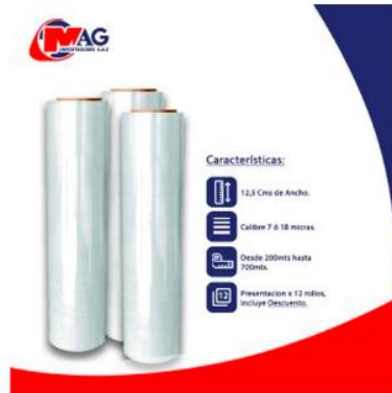
Vinipel Transparente de 12,5 Cm x 12 Rollos