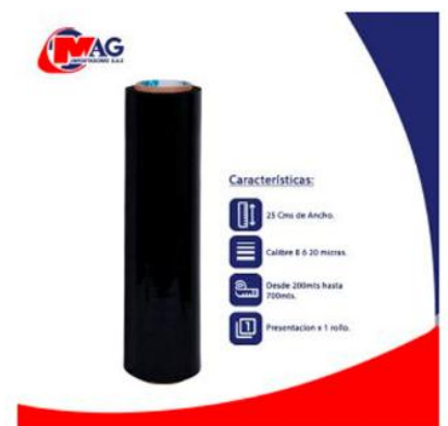
Vinipel Negro de 25 Cms x 1 rollo