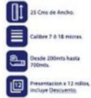
Vinipel Transparente de 25 Cms x 12 Rollos