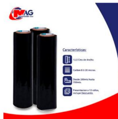
Vinipel Negro de 12,5 Cms x 12 Rollos