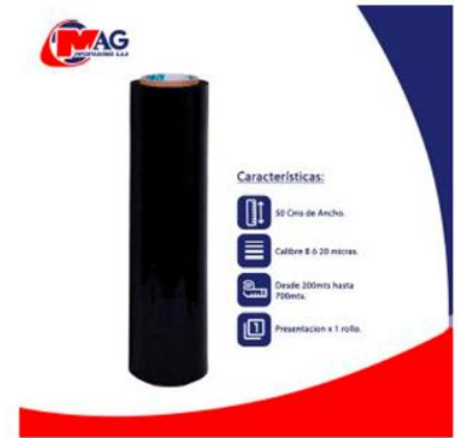
Vinipel Negro de 50 Cms x 1 rollo