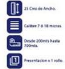
Vinipel Transparente de 25 Cms x 1 rollo