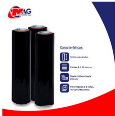
Vinipel Negro de 30 Cms x 6 Rollos