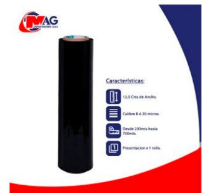
Vinipel Negro de 12,5 Cms x 1 rollo