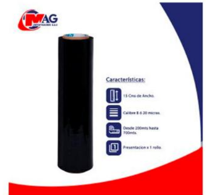
Vinipel Negro de 15 Cms x 1 rollo