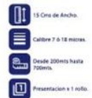
Vinipel Transparente de 15 Cms x 1 rollo