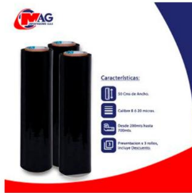
Vinipel Negro de 50 Cms x 3 Rollos