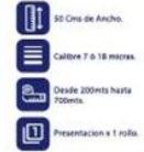
Vinipel Transparente de 50 Cms x 1 rollo