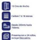
Vinipel Transparente de 15 Cms x 24 Rollos