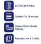
Vinipel Transparente de 20 Cms x 1 rollo