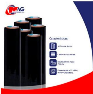
Vinipel Negro de 30 Cms x 12 Rollos